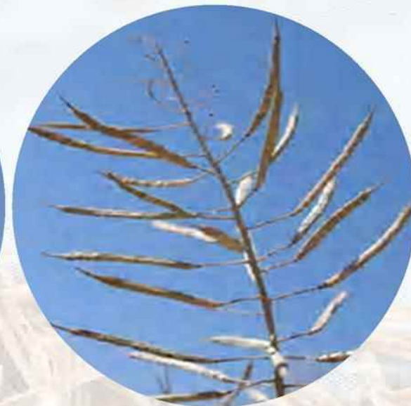
تفاوت شکل غلاف در کلزا (سمت راست) و خردل وحشی (سمت چپ)