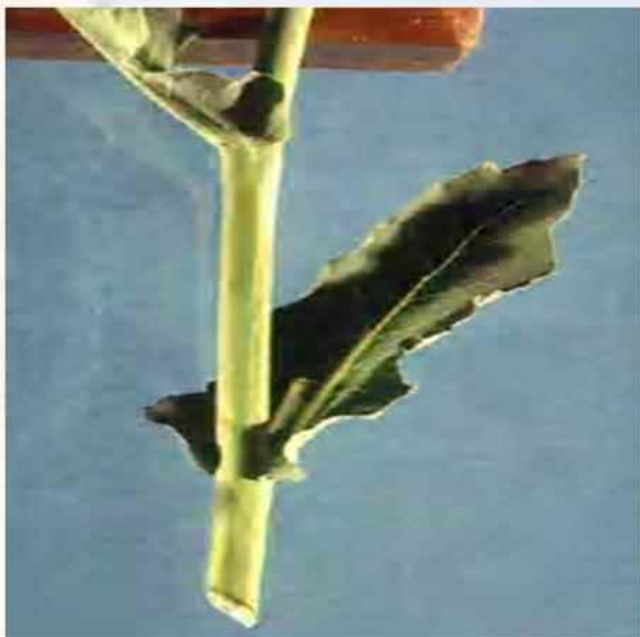
غلاف برگ در ساقه گل دهنده کلزا، رقم B. napus