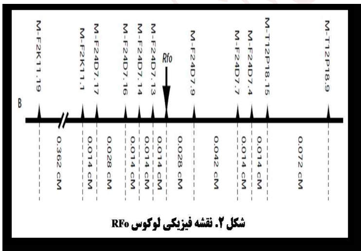
شکل ۲. نقشه فیزیکی لوکوس Rfo