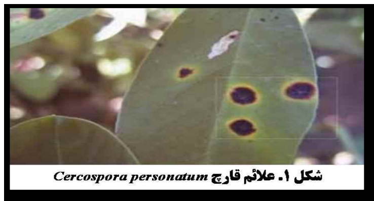
شکل ۱. علائم قارچ Cercospora personatum

عوامل قارچی مختلفی باعث ایجاد علائم لکه برگ در بادام زمینی می شوند که دو گونه آن از بقیه مهم تر است. نخستین علائم قابل مشاهده در ابتدای فصل مربوط به گونه Cercospora personatum (شکل ۱) و لکه های آخر فصل مربوط به گونه Cercospora arachidicola می باشد. لکه های اول فصل به رنگ قهوه ای روشن تا تیره بوده و با یک هاله زرد رنگ احاطه شده اند ولی در لکه های آخر فصل، این هاله دیده نمی شود. با مشاهده نخستین لکه ها در مزرعه، باید سم پاشی با قارچ کش های معمول مانند فولیکور و آلتو انجام و در صورت نیاز، دو هفته پس از نخستین سم پاشی، از یک قارچ کش حفاظتی مانند کلروتالونیل استفاده، تا از بقا و گسترش عامل بیماری در مزرعه جلوگیری گردد.