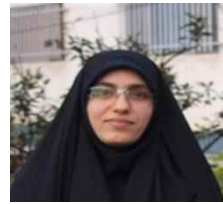
مهندس منتاب مودی