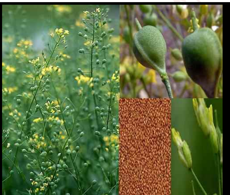
شکل ۲. گیاه Camelina sativa