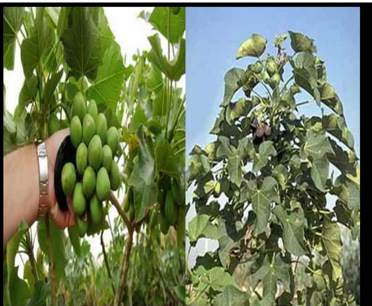
شکل ۱. گیاه Jatropha curcas

Lu, C. A Napier, J. E Clemente, T. B Cahoon, E. 2010. Current Opinion in Biotechnology. 22:252-259.